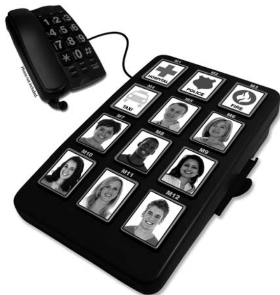
ITGS-450 Composeur Photo Manuel